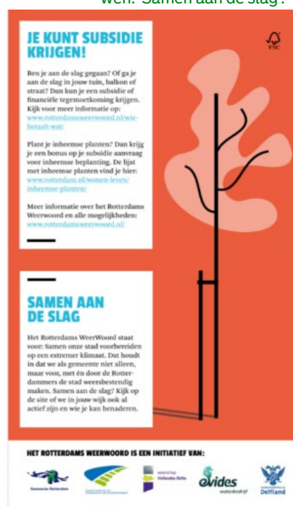
Figuur 4. Een voorbeeld van uitgesproken vertrouwen: 'Samen aan de slag'.

De gemeente wil graag vergroenen samen met de Rotterdammers. In haar communicatie benadrukt de gemeente dit vaak, zoals in het voorbeeld hier naast. Soms echter, als het gaat over wat wel en niet mag met betrekking tot vergroening, ondersteunt de toon dit echter niet altijd. Beoordeel in hoeverre de regels en communicatie over groen gedrag de Rotterdammers benaderen vanuit vertrouwen in plaats van wantrouwen, en pas dit aan op de plaatsen waar dit nog niet gebeurt.