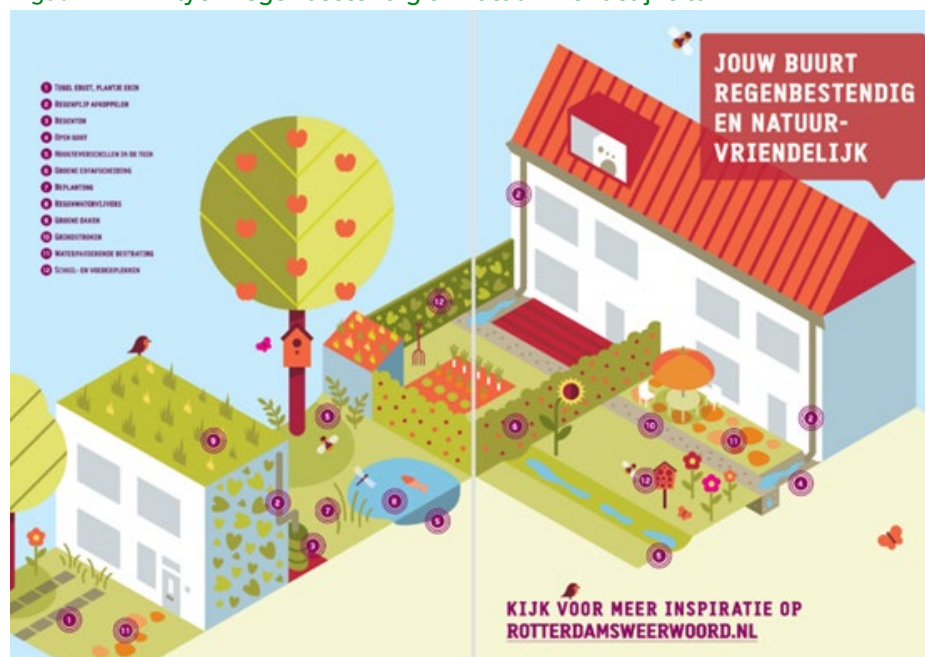
Figuur 2. Flyer Regenbestendig en natuurvriendelijke tuin

Het is ook essentieel dat de communicatie verschillende doelgroepen aanspreekt, bijvoorbeeld mensen met tuinen, mensen met balkons, eigenaren en huurders en mensen met verschillende kennisniveaus. Nu zien we nog te veel een algemeen verhaal dat vooral gericht lijkt op tuinbezitters met bovengemiddeld veel kennis en interesse in groene thema's. Bied informatie en mogelijkheden voor elke groep die je tot handelen wilt aanzetten en leidt ze direct met aansprekende beelden naar de voor hen relevante informatie.